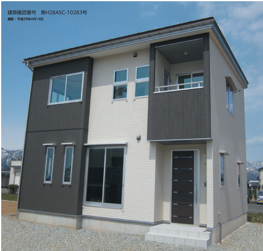
建築確認番号 第H28ASC-10283号 撮影：平成29年4月14日

期間 4/29(土)・30(日) ▶ 5/3(水)・4(木)・5(金)・6(土)・7(日) am10:00~pm5:00